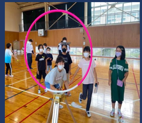
ドローンプログラミング教室