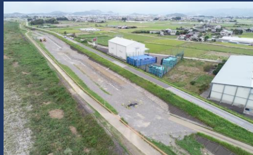
出水期施工完了 (ドローンによる空撮)

工事が再開しますと、堤防上を大型車両が多く通行致します。皆様の安全を確保するために、法定速度の順守・交通誘導員を配置し、一般車両優先で作業を行います。工事中はご迷惑をお掛けしますが、ご理解・ご協力のほど宜しくお願い致します。