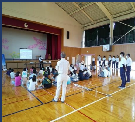
工事の説明を受ける子供達

10月5日に舟入小学校の5・6年生を対象にドローンプログラミング教室を実施しました。ドローンを使って楽しみながら教えると同時に、現在の建設現場での新技術を知ってもらい、将来の就職希望の一つに建設業が選択される様に取り組んでいます。子供たちは初めての体験に戸惑いながらも友達と協力し考え、プログラミング通りに飛行出来た時には、満面の笑顔で楽しんでいました。