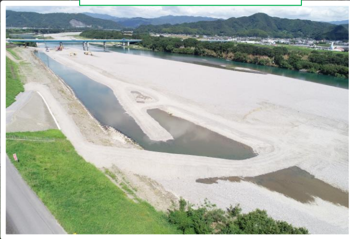
工事用道路・仮設坂路設置間完了